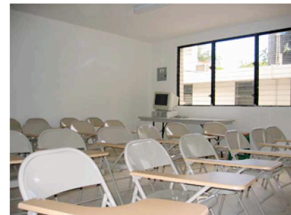
Salle de formation

fois les familles attendaient dans la cour extérieure.