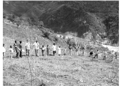
Les enfants, accompagnés du personnel et des responsables, font la ronde pour la bénédiction du terrain

L'argent que nous accumulons servira principalement à l'établissement de ce nouvel orphelinat.