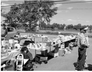
VENTE DE GARAGE ANNUELLE : UN FRANC SUCCÈS

Grâce à la collaboration d'une belle équipe, convaincue du bien-fondé de son action, notre vente de garage a rapporté la somme 1 220 $